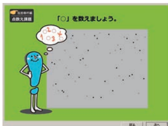
点数え課題 [指差] 視線が向きやすくなる