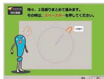
時計課題 [指差喚呼] 覚醒が保持される

社内研修などでまとめてご購入される場合は割引制度がございます。詳細はお問い合わせ下さい。