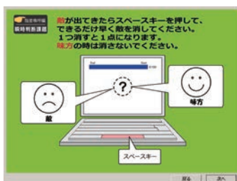
瞬時判断課題 [喚呼] エラーに気づきやすくなる