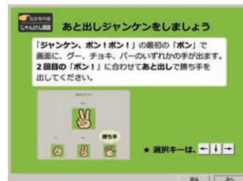
じゃんけん課題 [指差] 行動する前に一呼吸おける