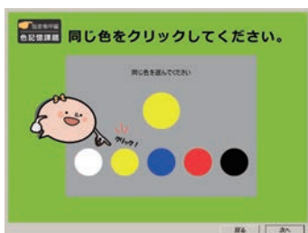
色記憶課題 [喚呼] 記憶が強化される